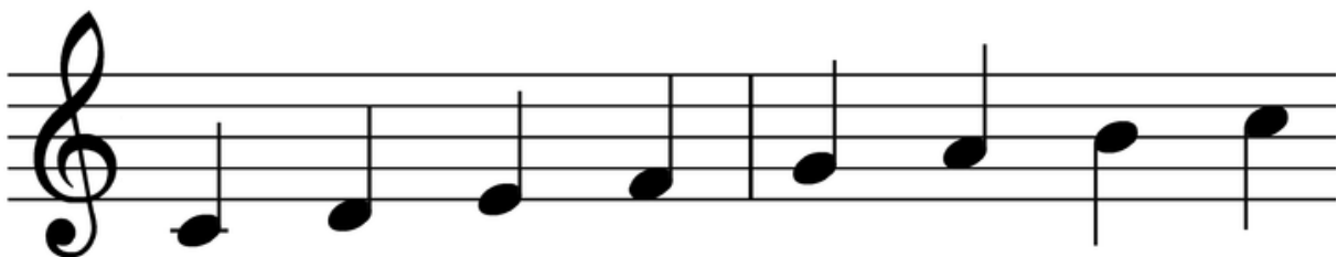
Die C-Dur Tonleiter